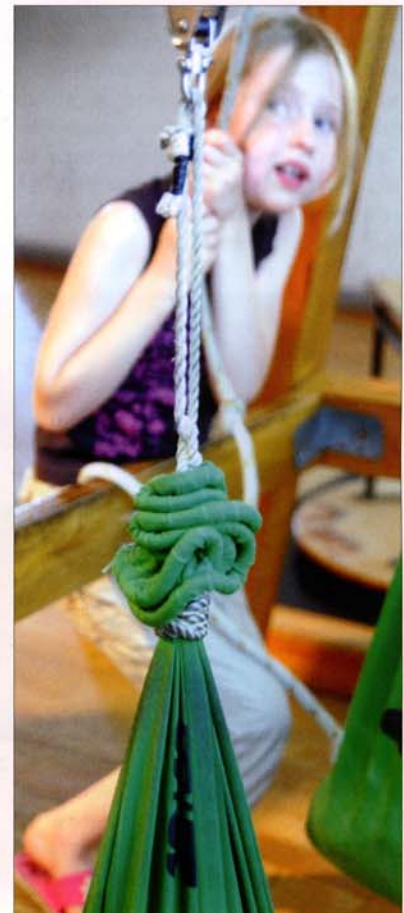
▲ Ein Experiment zum Thema Mechanik: Der Flaschenzug.

Ziele des Science Centers sind es, Lust auf Naturwissenschaften (und Technik) zu machen, mögliche diesbezügliche Berührungspunkte zu verringern sowie naturwissenschaftliche Prinzipien und Methoden zu vermitteln. Seine Ausstellung und Programme bieten ein Bildungsangebot, bei dem jeder und jede Einzelne selbst die Art und Tiefe der Auseinandersetzung wählen darf.