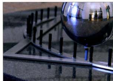
▲ Das Foucaultsche Pendel, gestiftet von den Freunden und Förderern des DTMB e. V., beweist, dass die Erde sich dreht.

Science Center heute rund 250 interaktive Experimentierstationen. Diese greifen nach wie vor vor allem Themen aus grundlegenden Teilgebieten der Physik auf. Stellvertretend genannt für die Vielzahl dieser Themenbereiche seien hier die Optik, die Mechanik und die Radioaktivität. Aber nicht nur physikalische Themen stehen im Zentrum des Interesses; auch angrenzende Wissenschaften – beispielsweise Mathematik, Nachrichtentechnik oder Astronomie – lassen sich mit Hilfe geeigneter Experimente zumindest in Teilgebieten selbsttätig erkunden. In der Regel erstreckt sich ein einzelner Themenbereich über einen oder zwei der mehr als zwanzig Ausstellungsräume. Insgesamt entsteht so eine eigene, vielfältige und vielschichtige bunte Experimentier-Welt, die nur wenig mit einem klassischen Museum gemeinsam hat.