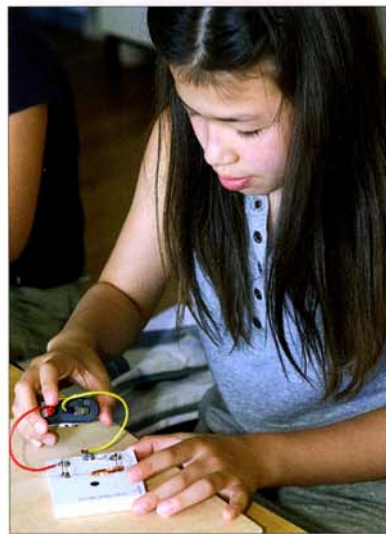
▲ Ob der selbst gebaute Elektromotor wohl funktioniert?