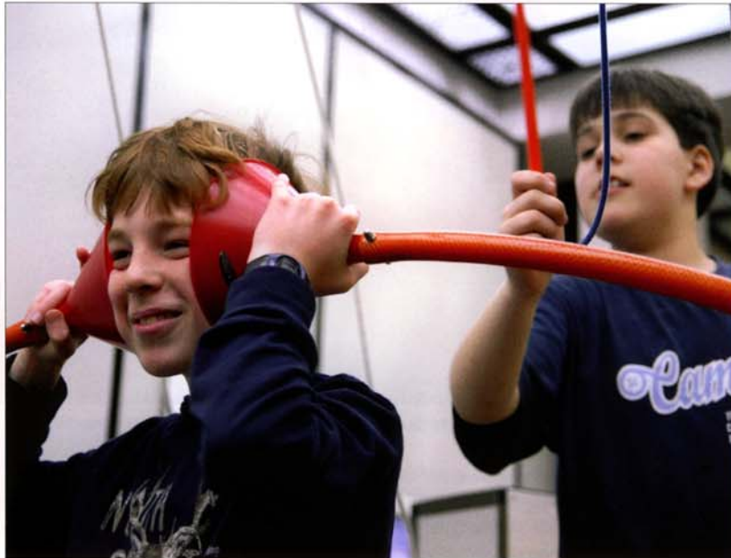
▲ Von wo kommt der Schall? Kinder beim Experimentieren im Science Center Spectrum, Möckerstraße 26.

Kann man Wärme sehen? Warum ist der Himmel blau? Und: Wieso fällt ein Flugzeug nicht vom Himmel? Dies sind nur drei typische von vielen hundert Fragen, deren Antworten es im Science Center Spectrum selbständig zu erforschen gilt. Doch wie kam es überhaupt zum Spectrum, das sich solcher und ähnlicher Fragen widmet?